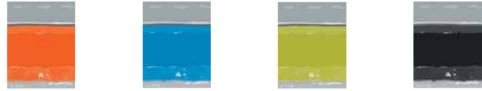
Arancione Orange Orange Orange Naranja A1 Blu Blue Bleu Blau Azul A2 Verde Green Vert Grün Verde A3 Grigio Grey Gris Grau Gris A4

Strutture Bodies Structures Korpus Estructuras