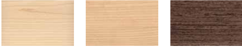
Acero Maple Erable Ahorn Arce AC Cilegio Cherry Merisier Kirschbaum Cerezo CL Wengè Wengè Wengè Wengè WE

Melaminici Melamines Mélaniniques Melamin Melaminicos