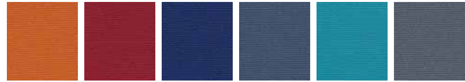
Arancione Orange Orange Orange Naranja AN Rosso Red Rouge Pot Rojo RR Blu Blue Bleu Blau Azul BU Blu avio Sky blue Bleu clair Blau himmelblau Azul "Avio" BA Verde Acqua Aqua green Vert d'eau Wasser grün Verde agua VQ Grigio Grey Gris Grau Gris GG