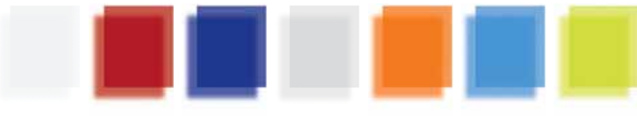
Trasparente Transparent Durhsichtig Transparente TR Rosso trasparente Red transparent Rouge transparent Durhsichtig rot Rojo transparente RS Bleu transparente Blue transparent Bleu transparent Durhsichtig blau Azul transparente BL Bianco satinato Satin-finish white Blanc satiné Weiß satinierte Blanco satinado BN Arancione satinato Satin-finish orange Orange satiné Orange satinierte Naranja satinado AR Blu satinato Satin-finish blue Bleu satiné Blau satinierte Azul satinado BT Verde satinato Satin-finish green Vert satiné Grün satinierte Verde satinado VV

Metacrilato Metacrylate Métaacrylate Metakrylat Metacrilato