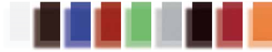
Goffrato bianco Embossed White Gauffré blanc Matt Lackiert Weiss Gofrado blanco GW Goffrato Moka Embossed Mocha Gauffré Moka Matt Lackiert Mokka Gofrado Cafe GF Goffrato Indaco Embossed Indigo Gauffré Indigo Matt Lackiert Indigoblau Gofrado Azul Indigo GD Goffrato Rubino Embossed Ruby Gauffré Rubis Matt Lackiert Rubinrot Gofrado Rubi GO Goffrato Cedro Embossed Lime green Gauffré Vert Cédrot Matt Lackiert Zitronatgrün Gofrado Verde Cedro GR Goffrato Argento Embossed Silver Gauffré Argent Matt Lackiert Silber Gofrado Plata GZ Goffrato nero Embossed black Gauffré noir Matt Lackiert schwarz Lacado negro GY Goffrato rosso "F" Embossed red "F" Gauffré rouge "F" Matt Lackiert Rot "F" Lacado rojo "F" GQ Goffrato arancione Embossed orange Gauffré indigo Matt lackiert orange Lacado naranja GX

Pianti Vetro Glass shelves Plans en verre Glasplatten Sobres en cristal