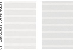
Bianco rigato Rippled effect white Blanc avec rayures en sérigraphie Linierte weiß Blanco rayado Grigio rigato Rippled effect grey Gris avec rayures en sérigraphie Linierte grau Gris rayado

Scocca contenitori Structure rangements Schrank korpus Estructura contenedores