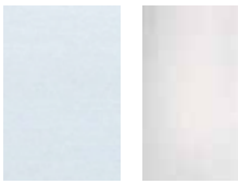
Alluminio Aluminium Aluminium Aluminium Alluminio brill Aluminium brill Aluminium brill Aluminium brill

Strutture Bodies Structures Korpus Estructuras