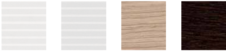
Bianco rigato Rippled effect white Blanc avec rayures en sérigraphie Linierte weiß Blanco rayado MB Grigio rigato Rippled effect grey Gris avec rayures en sérigraphie Linierte grau Gris rayado MG Rovere chiaro Light oak Chêne clair Helles Eichenholz Roble claro MC Rovere moro Dark oak Chêne foncé Dunkles Eichenholz Roble oscuro MM

Melaminici Melamines Mélaniniques Melamin Melaminicos