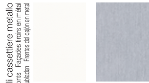
Bianco White Blanc Weiß Blanco Alluminio Aluminium Aluminium Aluminium

Scocca cassettiere Pedestal Body Structure caisson Rollocontainer Korpus Estructura bucs