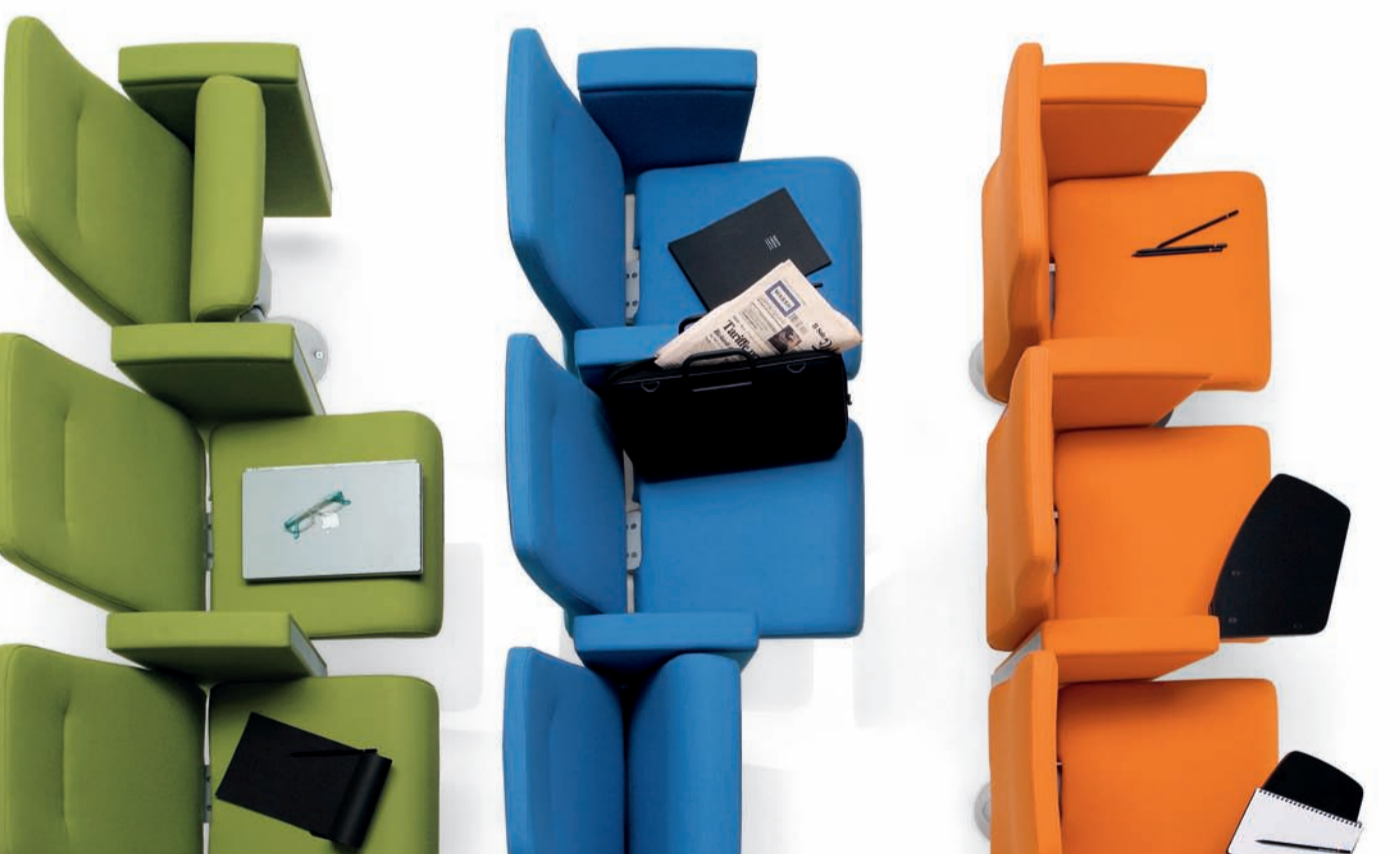
www.emmegi.com - Foto: G. Basso - Architetto: Massimo Sestini - Foto: G. Basso - Architetto: Massimo Sestini - Foto: G. Basso - Architetto: Massimo Sestini